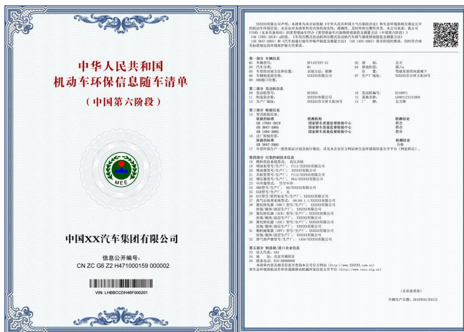
图 A.1 机动车环保信息随车清单示例