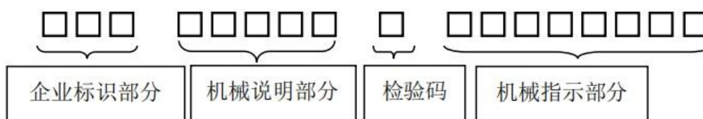
图 B.2 机械环保代码说明